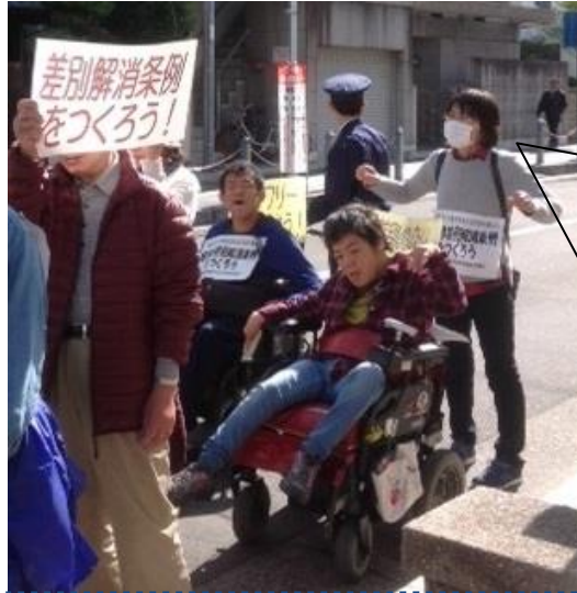
こえああげるふおーらむめんばーたち 声を上げるフォーラムメンバーたち