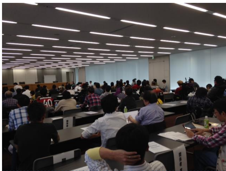
とうじつ かいじよ ようす 当日の 会場の 様子。