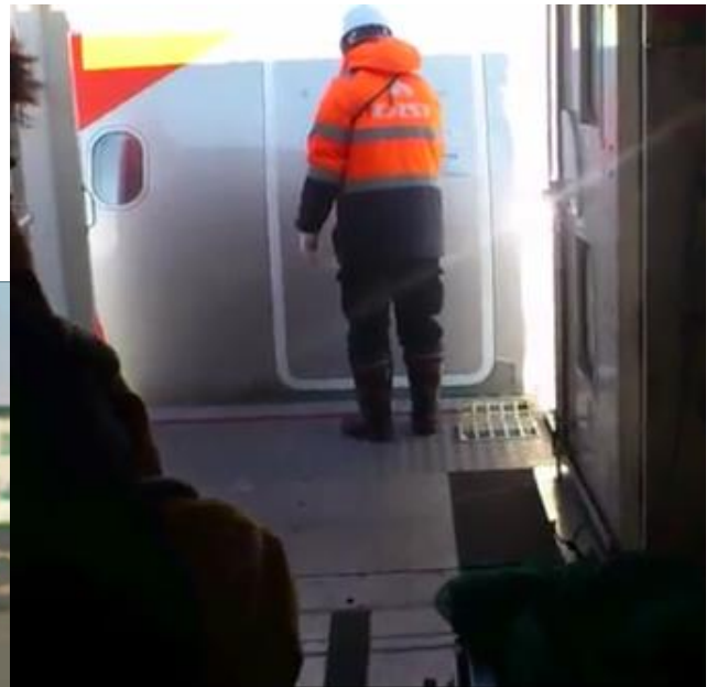
トラックから、いざ飛行機へ！

そんな対応の違いに、疑問を感じつつの北海道中でした。ちなみに、ライブは熱～いライブができました。