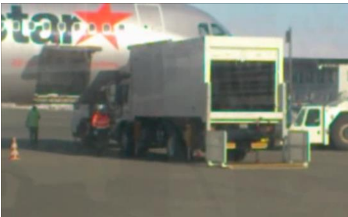
このトラックに乗って、飛行機へ