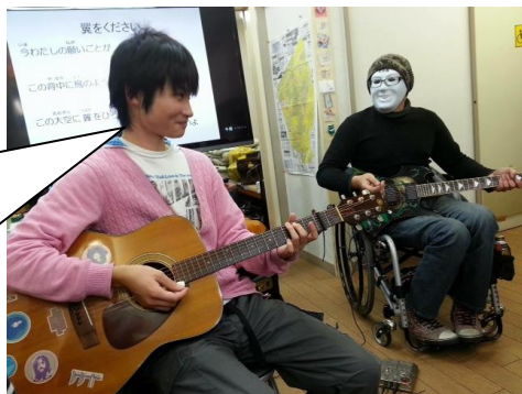
2015年度クリスマス会