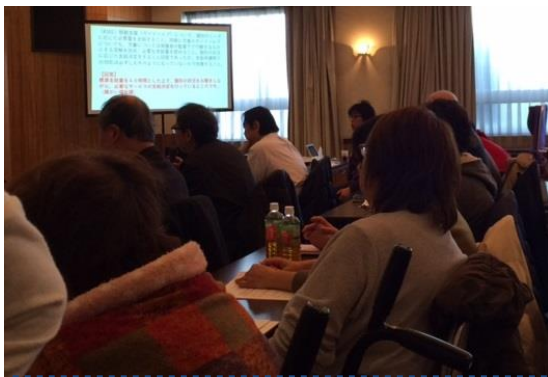
かいじょう ようす 会場の様子 その1