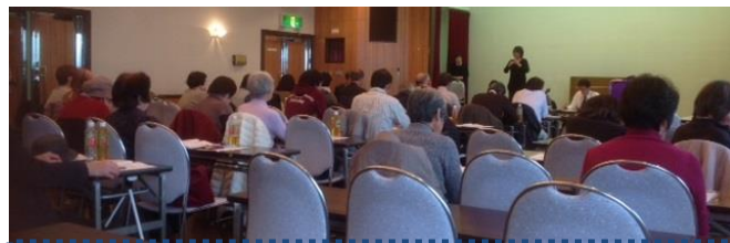
かいじょう ようす 会場の様子 その2

ことや、視覚障害者は介助が普通よりかかるからとの話しであるが身体障害者も介助に時間がかかるのは同じであると思います。そこで時間数に差が生まれることはおかしいのです。障害者間の差別を生む事になると訴えて行きました。私は、気分が悪くなって途中で退席してしまいましたが、相変わらずの回答だったみたいです。(マー)