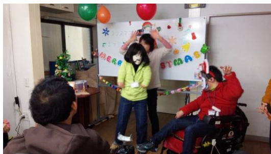
2014年度クリスマス会