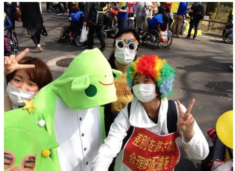
はなやかな仮装で

「障害者差別解消法」は文字通り、障害者に対しての差別をしてはいけないという法律で、例えば、段差がありお店に入れないなどということも無くさなければならぬという内容の、当事者が長年闘って制定された法律です。(民間は努力義務ですが…) しかしながら、パレード前に立ち寄ったコンビニは店の前に段差があり車いすで入れないというもので、まだまだ合理的配慮がなされていないことを実感しました。今月28日には、大阪でも同様の趣旨のパレードがあります。ご都合付けは一緒に参加しませんか？(ひろき)