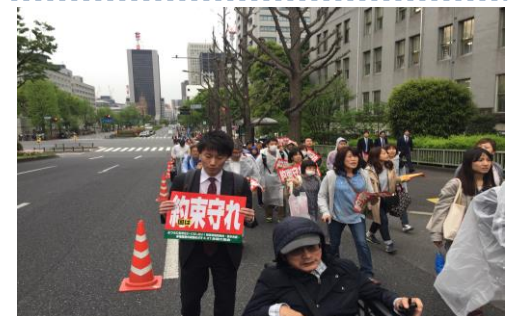
ながたちょう ながたちょう 永田町 えいだまち までデモ行進 でもこうしん