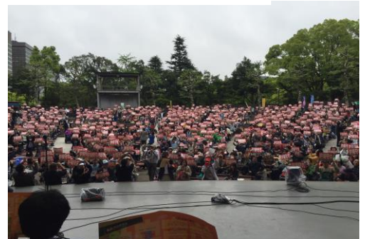
「約束守れ」のカード かーど でアピール あひーる