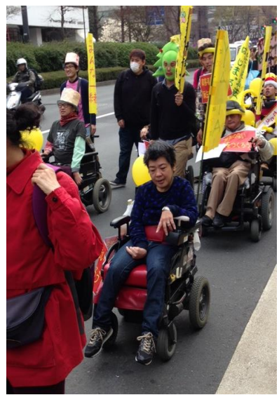
たくさんの仲間と

ただ、厚労省の近くのコンビニにおにぎりを買に行ったのに段差があって入れませんでした。銀行にも行きかけたけれど、そこも階段があって入れませんでした。厚労省の近くのコンビニになぜかな？ 厚労省の近くにコンビニがあるということに入ったものの、やっぱり関係者でないという理由で入れませんでした。本当に「差別を解消する気があるのか」と疑いました。(まー)