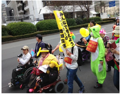
コーンをあげながら

3月31日(木)、東京日比谷公園で「障害者差別解消法」の誕生を祝うパレードに参加しました。久しぶりに嬉しい行進でした。全国から600人を超える障がい当事者、支援者が集い、センターたかつきからも15人ほどの仲間が朝早くから会場へ向かいました。参加者はみんな思い思いの仮装で、日比谷公園から銀座通り、東京駅へと行進し、街行く人々に「障害者差別解消法」の施行を訴えていきました。私たちもカエルの着ぐるみや、クリスマスツリーの帽子をかぶるなど、大変な盛り上がりでした。