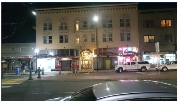
今回滞在したナッシュホテル