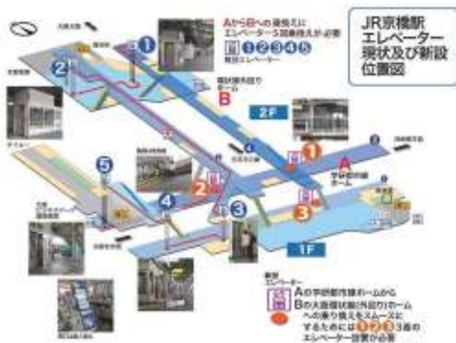
じえいあーるきょうばしえきこうない えれべーたいちす JR京橋駅構内のエレベーター位置図