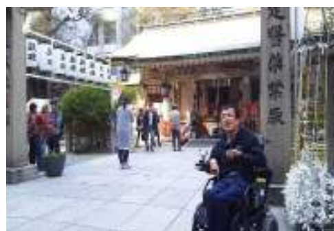
だんせいちーむはつてんじん 男性チームもお初天神に