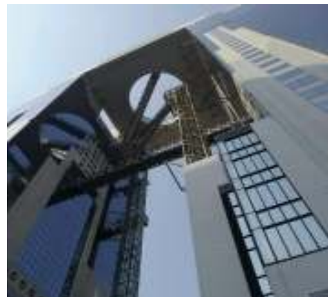
すかいびるしたからぱちり スカイビルを下からパチリ

今回はハプニングもなく、楽しく？終わることができ、よかったよかった。どの班も頑張ったせいかな、お疲れのご様子でした。受講生のみなさま、改めて、お疲れさまでした。今後、少しでも私達と関わっていただけたら嬉しいです。よろしくお願ひします！（みか）