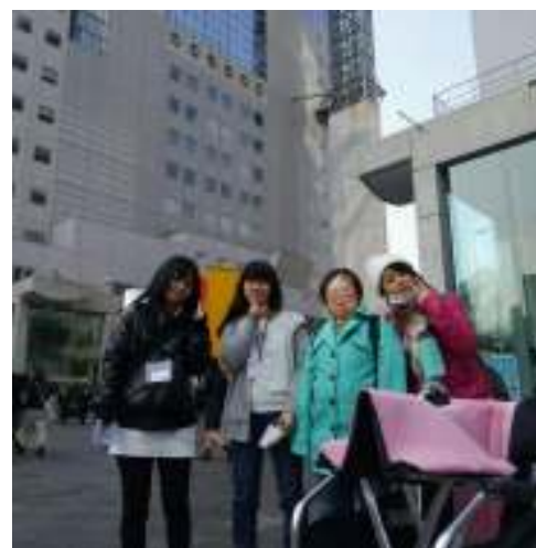
すかいびるまえまい スカイビル前で1枚