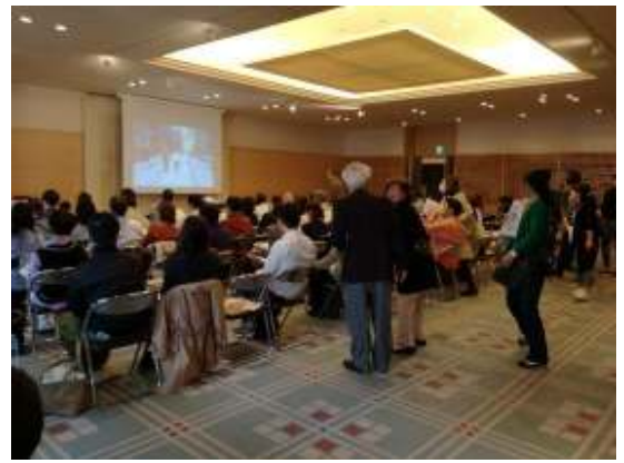
かいじょう まんいん 会場は満員でした

つい、最後まで人の話を聞かず割り込んだり、否定から入ってしまいがちな私にとっては、とてもたくさんの気づきを得ることができた講演でした。日頃の話合いや相談でも、生かしていければと思います。(いづつ)