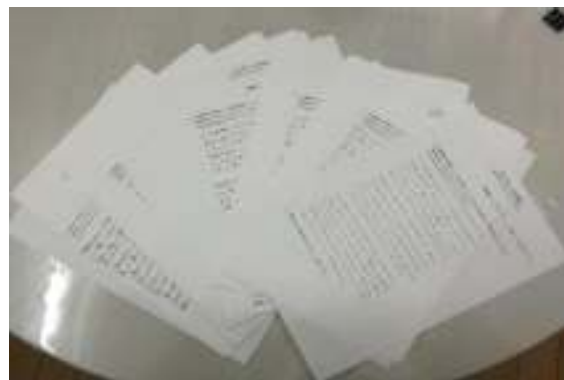
たくさん感想をいただきました