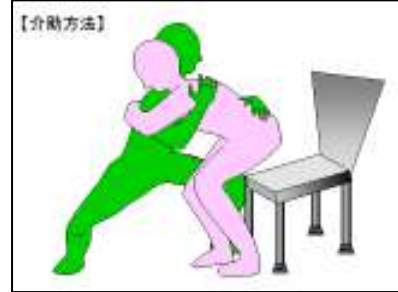
(株)ケア・センスHPより

http://kaigonochishiki.com/gijutsu/gijutsu003