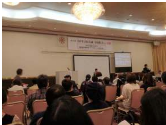
午前中の全体会のようす

ここでは説明しきれないほどのたくさんのテーマが扱わ れた会議でした。興味を持たれた方は、事務所に資料がたく さんあるので、お立ち寄りの際は、ぜひ声をおかけ下さい。 (いづつ)