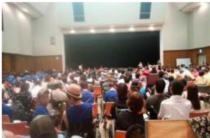
ねっき かいじょう 熱気がすごい会場