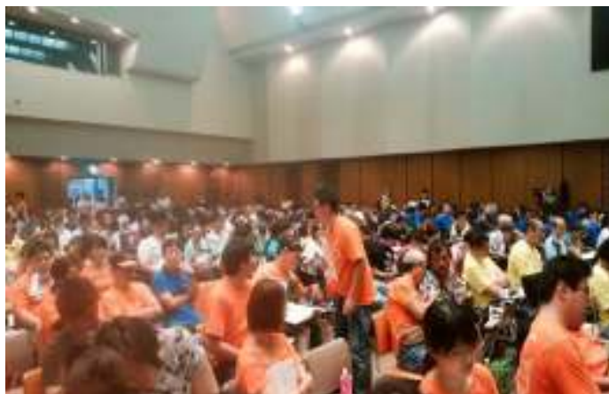
かいじょう さんかしゃ 会場は参加者でいっぱい

大阪府は、今年はずっと増して予算を削ろうとしています。絶対に許せません。オールラウンド交渉は、7月31日、8月3日、7日と今年は3日間に分けて行われます。全力で交渉に臨みましょう!! (まー)