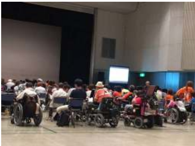
こうしょうみっかめ ねっき 交渉三日目 まだまだ熱気がすごい