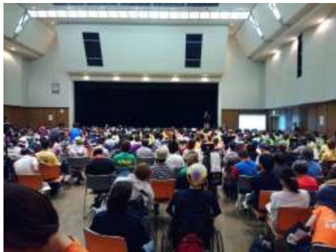
こうしょういちにちめ かいじょう まんぱい 交渉一日目 会場は満杯

年々知った顔が少なくなっていくように感じます。こころざし半ばにして亡くなった仲間が沢山います。悔しい想いが湧いてきました。(まー)