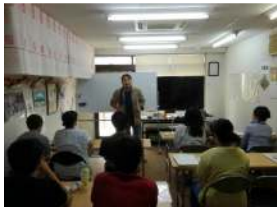
こうぎ いちにちめ ようす 講義一日目の様子

まだ9/30の外 出 実 習 が残っていますが、無事に事 故無く 終 了 して欲しいです。(まー)