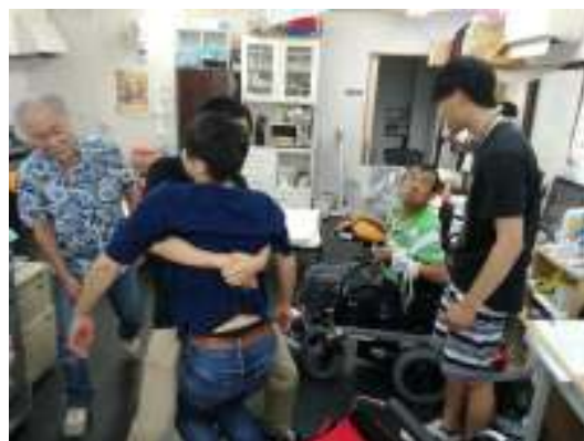
じゅうこうせい どうし だ 受講生同士で抱きかかえ