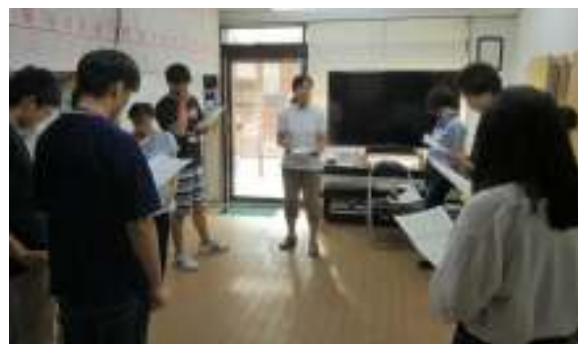
いじょう れんしゅう まえ あしば かくにん 移乗の練習の前に足場の確認