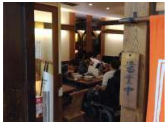
男性チームはラーメン